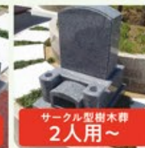
サークル型樹木葬 2人用~