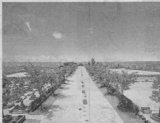
広々としたはびきの中央霊園

そのまま放置されてしまってお墓も増えている。そんな状況を改めたいと「お墓主義宣言」を掲げ、永代供養付きの霊園に力を入れているのが「加登」(大阪市淀川区)だ。 同社は年間2000基以上の墓石を建立するほか、寺院のコンサルティングや、区画数8000という大型霊園、完全バリアフリーの霊園のプロデュースから分譲・管理代行ま